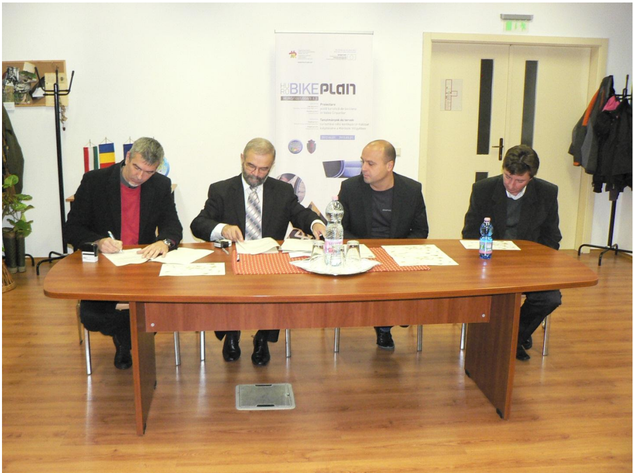
Békéscsaba, 2012. október 29.