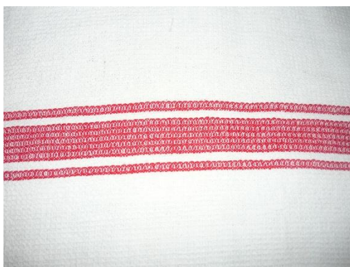
8. kép: 5 nyüstell szőtt daráztörülköző, takácsmunka, fehér-piros pamut, mérete: 50x100 cm, Debreczeni János tulajdona